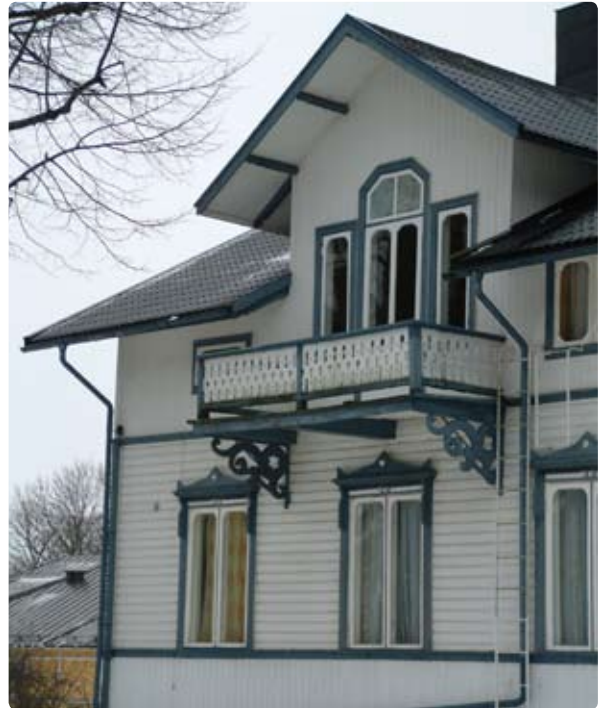
Arkitektur från det gamla Mariehamn visas i Jugendsalen.