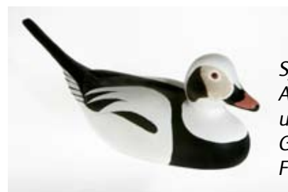
Synnöve Nordströms Alfågelvetta visas under Form.ax på Galleri Norsu