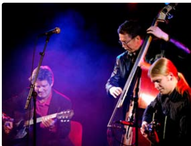
Whatclub (of Mariehamn) På stora scenen torsdag 14.6 kl. 14.45