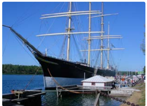
I Helsingfors Nationalbibliotek visas en caféutställning om Pommern.