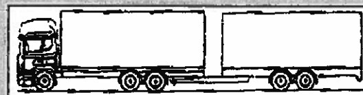
Bil + kärra