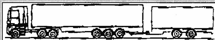
Bil + trailer + kärra