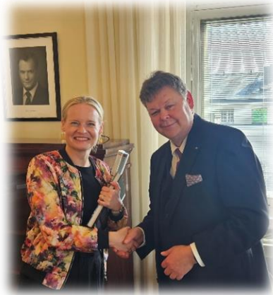
Minister Purra och minister Höglund

Ålands finansminister Roger Höglund (C) hade ett möte med finansminister Riikka Purra (Sannf) i Helsingfors den 22.9.