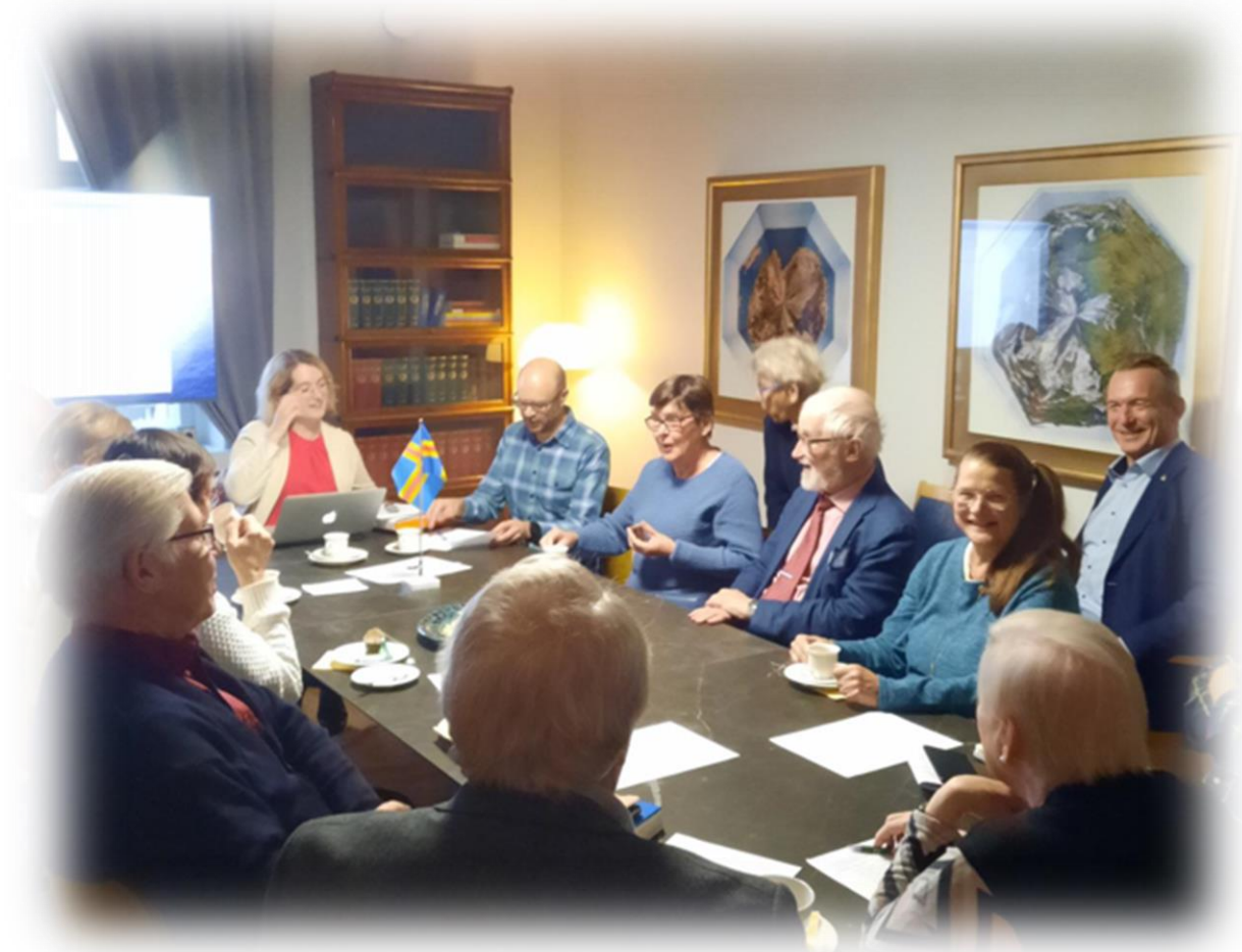
Ålandsvänner i Helsingfors.