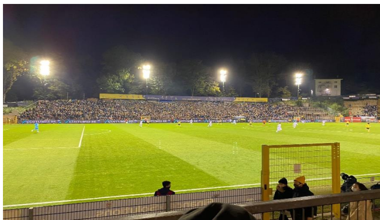
Hemmamatch på Stade Joseph Marien.

I söndags spelades Brysselderbyt och toppmötet mellan Union och RSC Anderlecht på Stade Joseph Marien, som slutade med 1-0 vinst för Union.