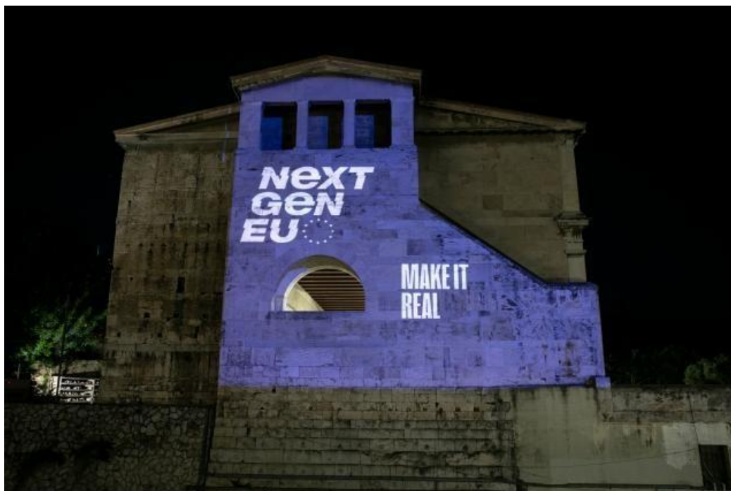
Antik romerska Agora upplyst under NextGenerationEU evenemanget i Aten.

För att förslaget om nya egna medel till budgeten ska kunna bli verklighet så krävs det att EU ändrar två centrala rättsakter. Den första ändringen är att lägga till de tre nya inkomstkällorna av egna medel till de redan befintliga. Den andra ändringen är en ändring av EU:s fleråriga budgetram. Ändringen av den fleråriga budgetramen skulle göra det möjligt att börja betala tillbaka upplåningen man tagit för "Next generation EU" redan under innevarande budgetram 2021-2027. Man föreslår även en höjning av utgiftstaken i budgetramen för åren 2025-2027 för ytterligare utgifter för den sociala klimatfonden.