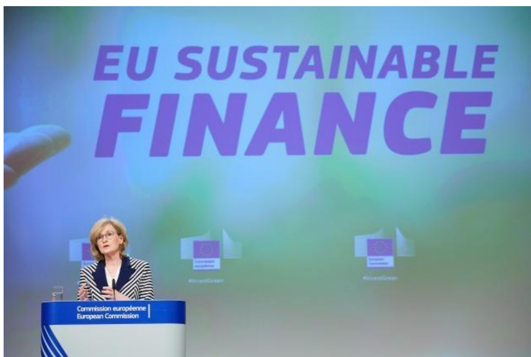
Kommissionär Mairead McGuinness.

Förslaget fick ett blandat mottagande som verkligen visar hur känslig frågan är. Vissa ansåg att det var en bra och nödvändigt förslag för att göra en smidig omställning till förnybara energikällor. Andra ansåg till exempel att förslaget skulle leda till att pengar som skulle gå till investeringar i förnybara energikällor kommer gå till annat om man inkluderar kärnkraft och naturgas i taxonomin.