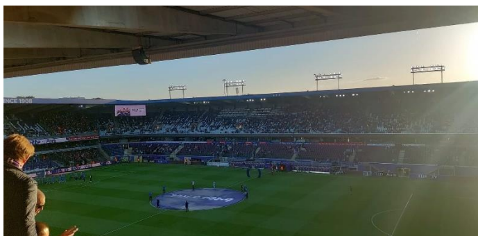
RSC Anderlechts hemmaarena Lotto Park.

Jag har själv sett ett antal Anderlecht matcher under min tid i Bryssel och har blivit lite av en supporter. Jag kommer att fortsätta följa RSC Anderlecht även efter min praktikperiod i Bryssel. Nedan kommer det några bilder från mina besök på Lotto Park.