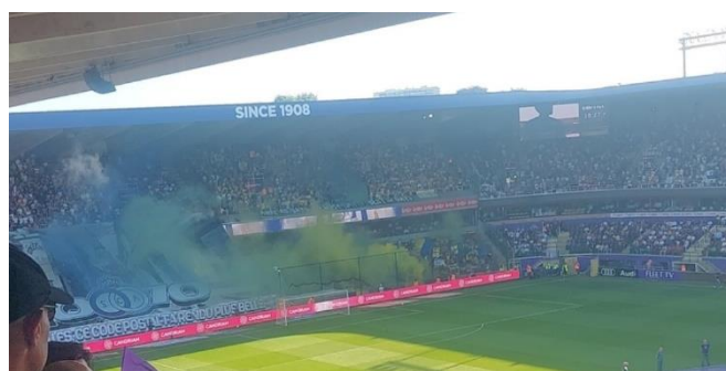
Brysselderby mellan RSC Anderlecht och Royale Union Saint-Gilloise.

Håll ögonen öppna för nästa nyhetsbrev i juni!