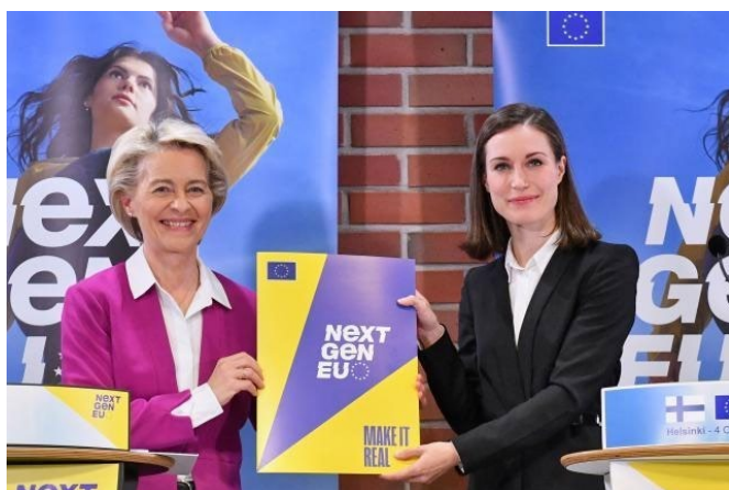
Kommissionens ordförande Ursula von der Leyen och Finlands statsminister Sanna Marin.