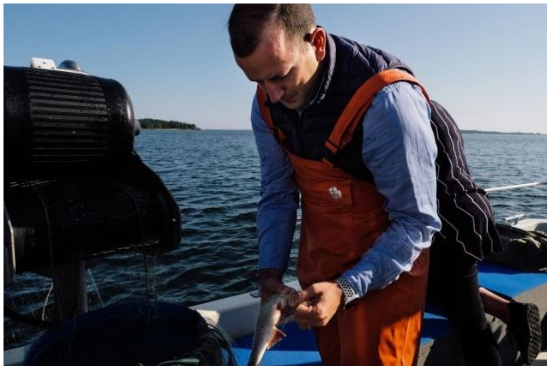
Kommissionär Virginijus Sinkevičius testade fiskelyckan på Åland för någon månad sedan.