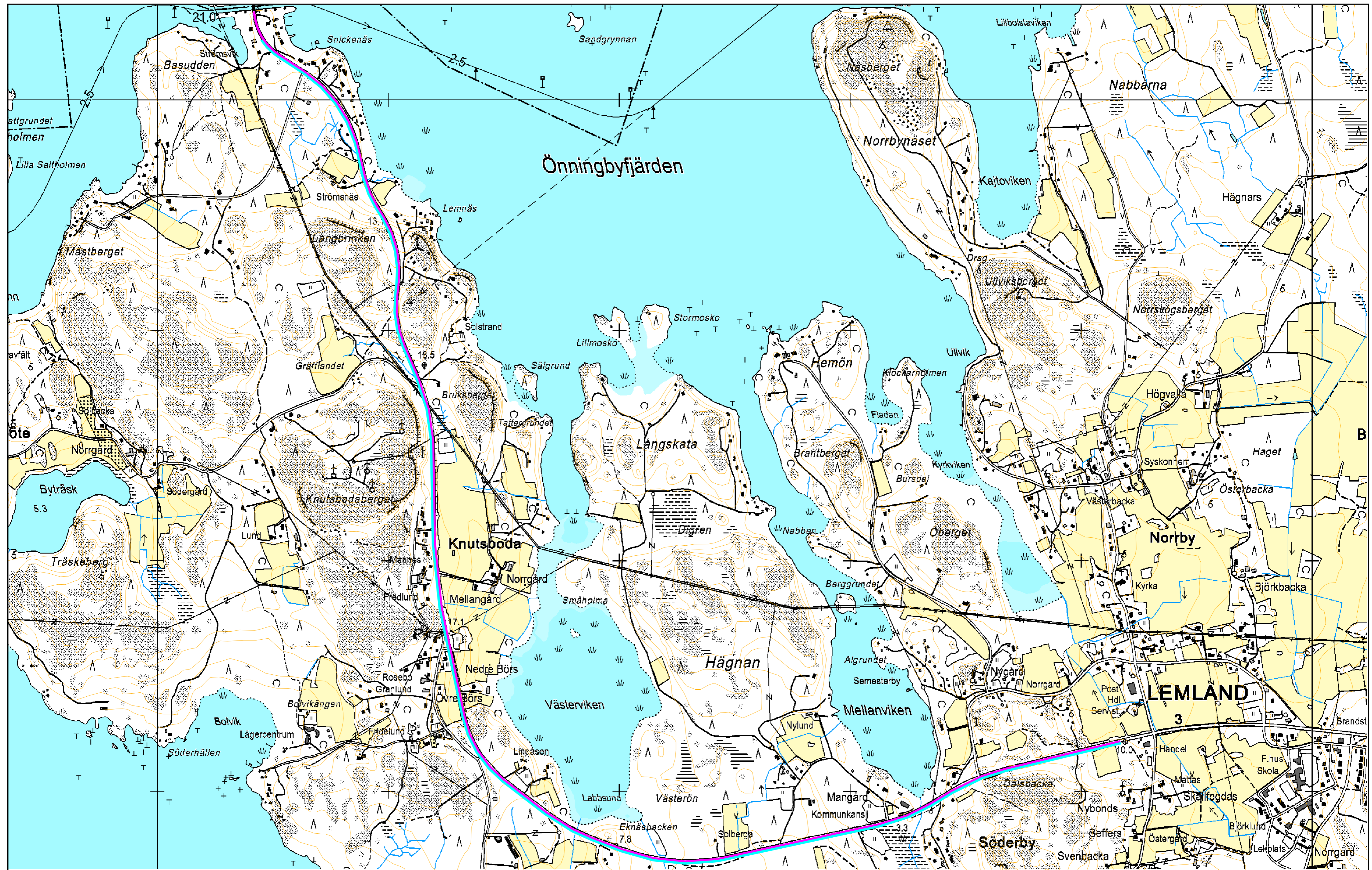
Ombyggnad av landsväg 3 och nybyggnad av parallell gång- och cykelväg mellan Lemström och Söderby