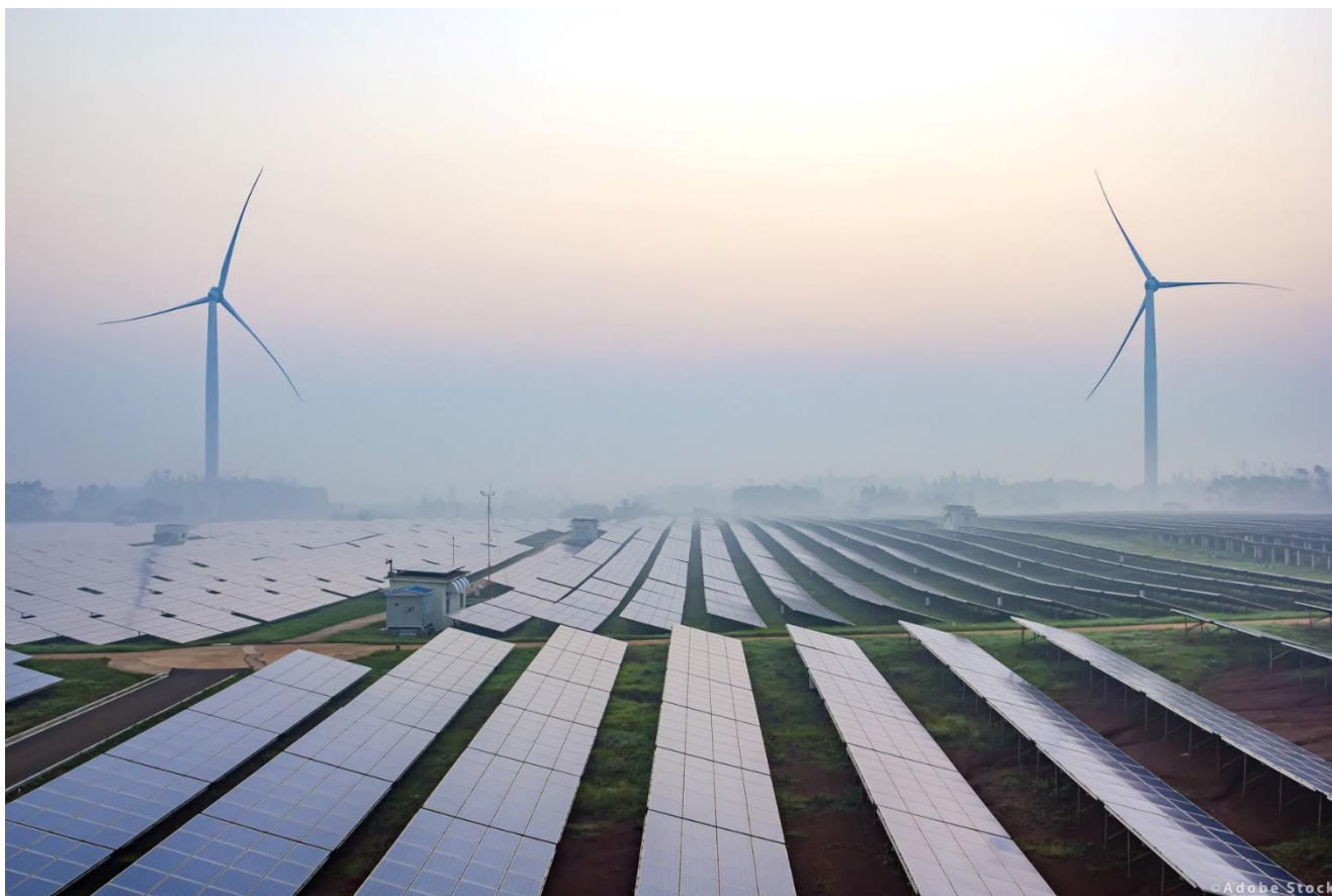
Klimatlagen påverkar nästan alla branscher och områden i samhället, däribland omställningen till hållbar energi som vind- & solenergi

Mer information om klimatlagen hittas här .