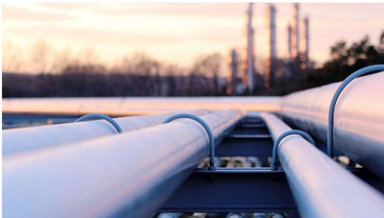
Energirådet träffas 11 juni för att fortsätta diskussionen kring revisionen av TEN-E-förordningen

Hela den förslagna revisionen hittas här & en Q&A hittas här .