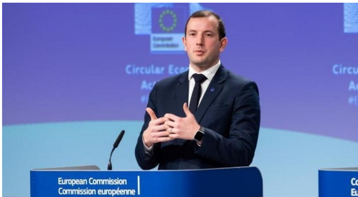
Kommissionären för miljö, hav och fiske, Virginijus Sinkevičius.

De huvudsakliga målsättningarna som nämns i deklarationen är motverkan av övergödning genom hållbart jordbruk, behovet av ett övervakningssystem för att motverka utsläpp i Östersjön samt att säkerställa hållbart fiske för att bevara biodiversiteten. I deklarationen slår ministrarna också fast att man vill förbättra möjligheten att kartlägga fiskemönster, följa vetenskapliga rekommendationer samt prioritera bestämmelserna i HELCOMS kommande Östersjöplan. Den slår även fast hur man ämnar finansiera projekten samt att de signerade länderna måste engagera sig i att verkställa EU:s existerande regelverk som möjliggör måluppfyllelsen. De specifika åtgärderna går att hitta här .