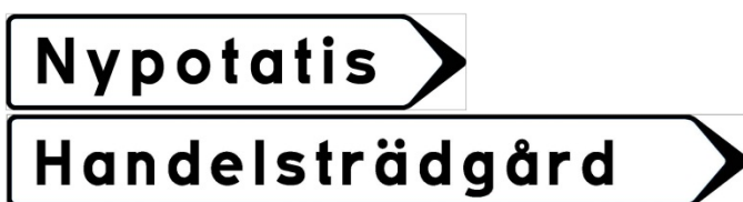
LS26 Tillfällig utmärkning