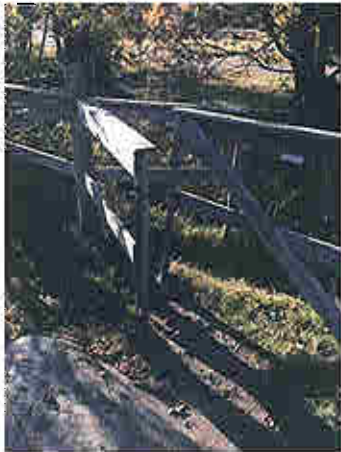
Fållan är inte möjlig att ta sig igenom med rullstol, barnvagn e t c.

Den fälla som leder in till stigen är mycket smal (28 cm passagebredd) , och sannolikt svår för många att ta sig igenom.