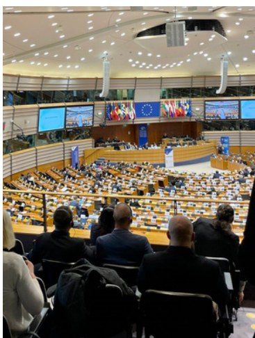
Studiebesök till Europaparlamentet.