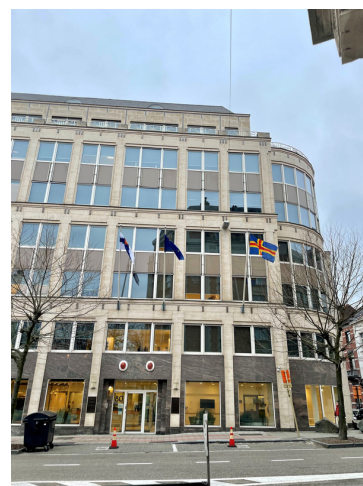
Bryssel har mest bjudit på moln och regn under februari, men en dag med t-shirtsväder har vi haft!

Mejlet skickas av Ålands landskapsregerings representant i Bryssel. Nyhetsbrevet skrivs och redigeras av Emma Lindvall. Tanken är att mejlet ska sammanlänka ålänningar med EU-frågor på agendan. Hör av er om ni har frågor eller specifika EU-ärenden ni vill att vi bevakar.