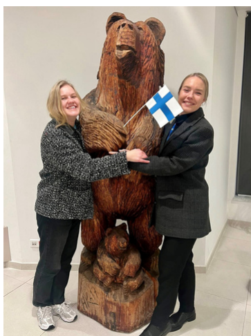
Röstning i presidentvalets andra omgång.