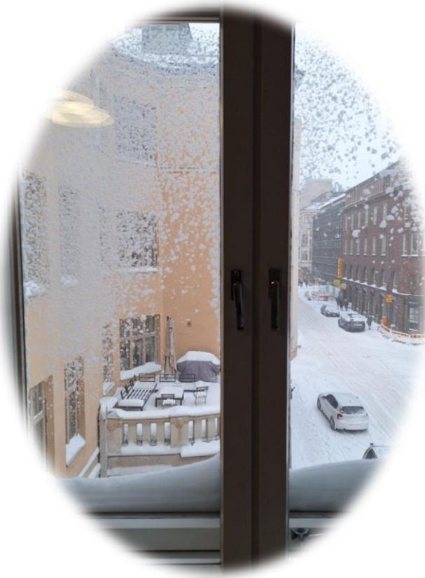
En vintrig bild från kontoret på Annegatan.

Nytt år och nya möjligheter! Mycket av månaden har använts för att planera för årets aktiviteter och verksamhet. De planerade projekten är många och frågor som behöver lösas och diskussioner som behöver föras är många.