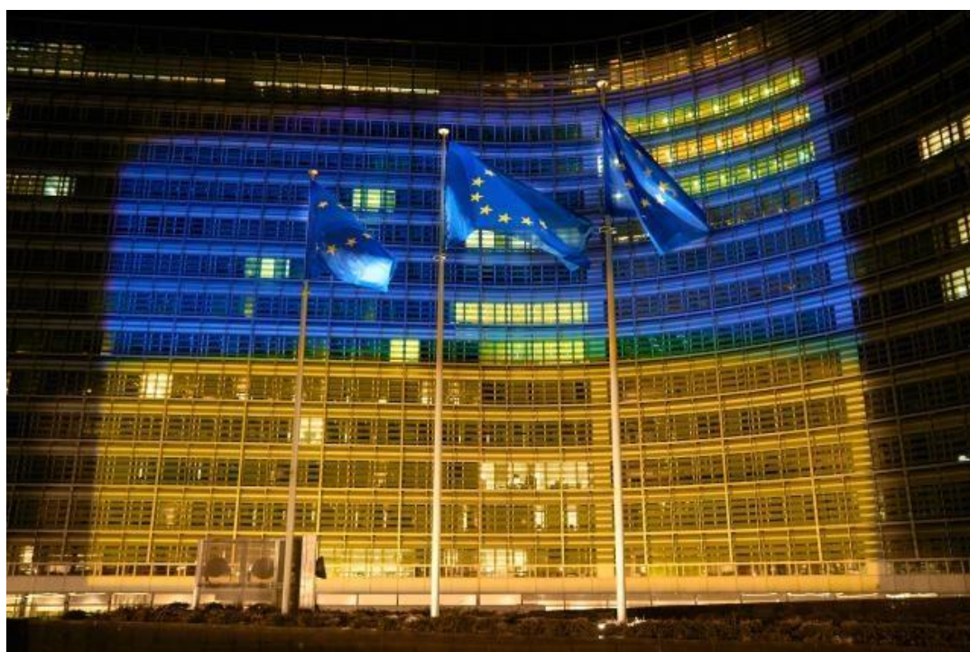
Kommissionens huvudbyggnad Berlaymont upplyst i Ukrainas färger.