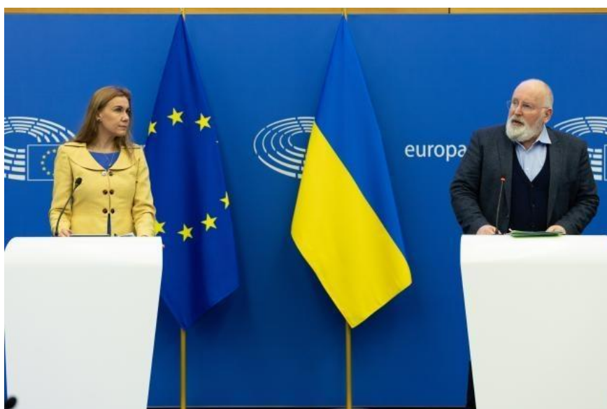
Energikommissionär Kadri Simson och kommissionens vice-ordförande Frans Timmermans som är ansvarig för den gröna given.

Kommissionen har presenterat flera förslag för att hjälpa medlemsstaterna hantera höga energipriser samt skydda företag och konsumenter från höga energipriser. Redan i oktober 2021 presenterade kommissionen några verktyg som medlemsstaterna kan använda för att skydda sårbara konsumenter och företag. Till verktygen hör till exempel energisubventioner, skattesänkningar och åtgärder för att undvika avstängningar av energinätet. Kommissionen säger också att medlemsstaterna under det nuvarande läget kan använda sig av reglerade energipriser för sårbara konsumenter, hushåll och mikroföretag. Andra verktyg som medlemsstaterna kan använda sig av är till exempel möjligheter att betala ut kortsiktiga statsstöd till utsatta företag eller möjligheten att använda intäkter från utsläppshandeln för att hjälpa hushållen.