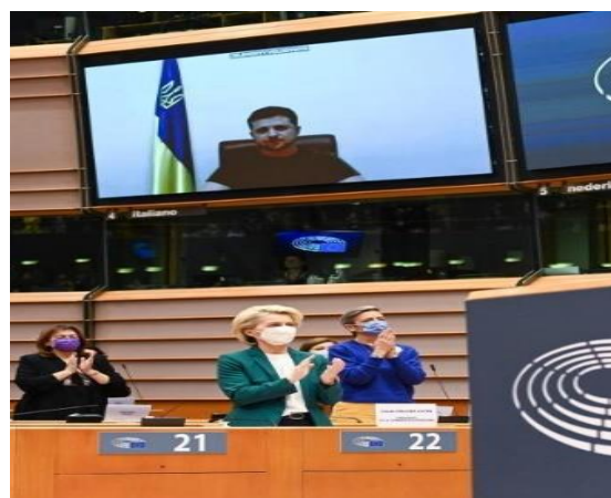
Volodymyr Zelensky deltar via länk på ett möte i Europaparlamentet.