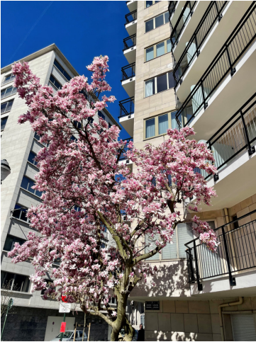
Körsbärsblommorna har slagit ut i Bryssel!