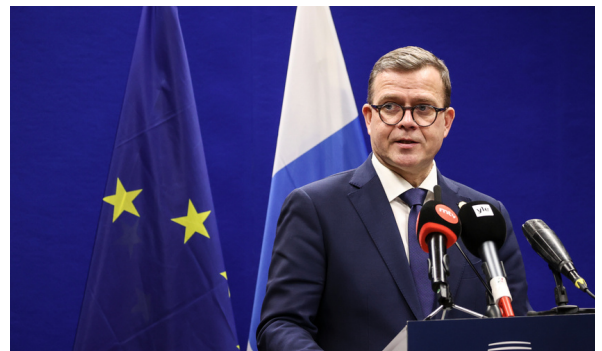
Statsminister Petteri Orpo presenterade Finlands mål i Europaparlamentet i Strasbourg i mars.

Landskapsregeringen lyfte också upp att Åland väntar på att Finland ska garantera en åländsk plats i Europaparlamentet.