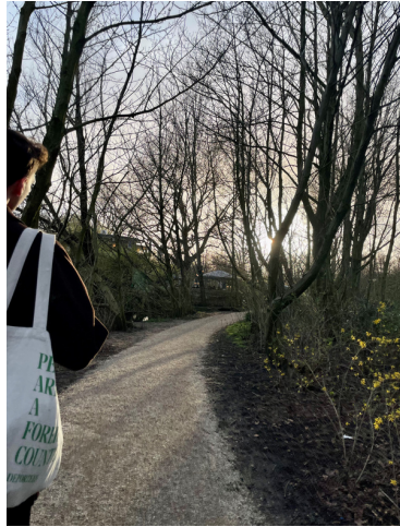
Solig promenad i Amsterdam.