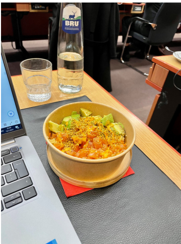
Emma var på ett Coreper 2-möte som slutade först vid kl. 23, vilket innebar att det serverades både middag och kaffe.