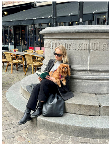
Kombinerade en lördag i Antwerpen med att vara hundvakt, sola och läsa.