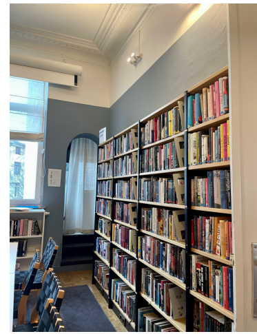
Finlands Sjömanskyrka bjuder på praktikantlunch ungefär en gång i månaden. De har också ett bibliotek med en del svenskspråkig litteratur!