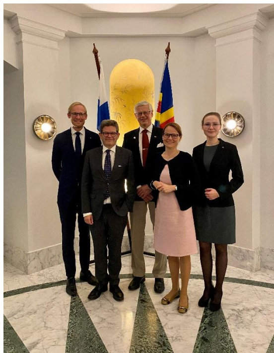
Inne på Finlands ständiga representation flaggade man med Åland och Finlands flaggor dagen till ära