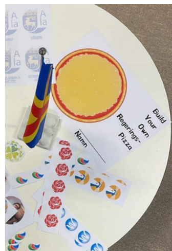
Valvake-pyslet "build your own regeringspizza" blev en stor succé bland deltagarna.