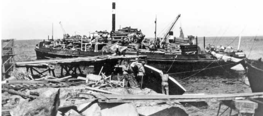
Kökar juli 1940: All lös materiel från fortet lastas på prämar och transporterats till Alskär strax öster om landskapsgränsen, för att där ingå i en ny huvudförsvarslinje.

som lämnats ifall arbetena måste kompletteras.