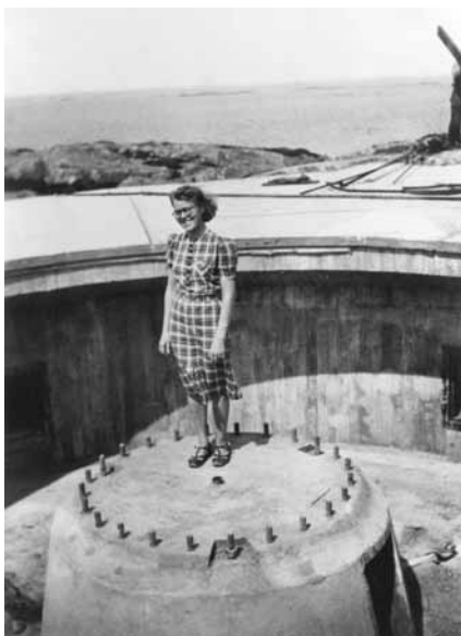
Kökar juni 1940: Kanonställning byggd av Skånska Cementgjuteriet och avsedd för 152 mm pjäs av typ Canet. Den glada damen är troligen fortchefens fru.

gjuteriet (dagens Skanska) om att bygga kustforten på Kökar och på Signilskär/Enskär. Under april anlände till vardera platsen ingenjörer och 30 byggnadsarbetare direkt från Sverige, tillsammans med monteringsfärdiga baracker samt fullständig maskinpark med kompressorer och bormaskiner. Från slutet av april pågick byggnadsarbetena dygnet runt i treskift, med understöd av lokal arbetskraft. I slutet av juni hade man på Kökar färdigställt en stor betongställning för en 152 mm pjäs, liksom en tillhörande 20 m lång bunker. Ytterligare tre likadana pjäsställningar var under arbete, liksom ett eldledningstorn och en mindre tunnelanläggning.