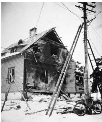
Privathus i Mariehamn svårt skadat efter bombanfall mot Västra hamnen 20 januari 1940.

närmast ubåten S-2 som 3 januari minsprängdes öster om Märket. Under flygkriget sköts därtill åtminstone tre bombplan ner av finskt jaktflyg över Skiftet.