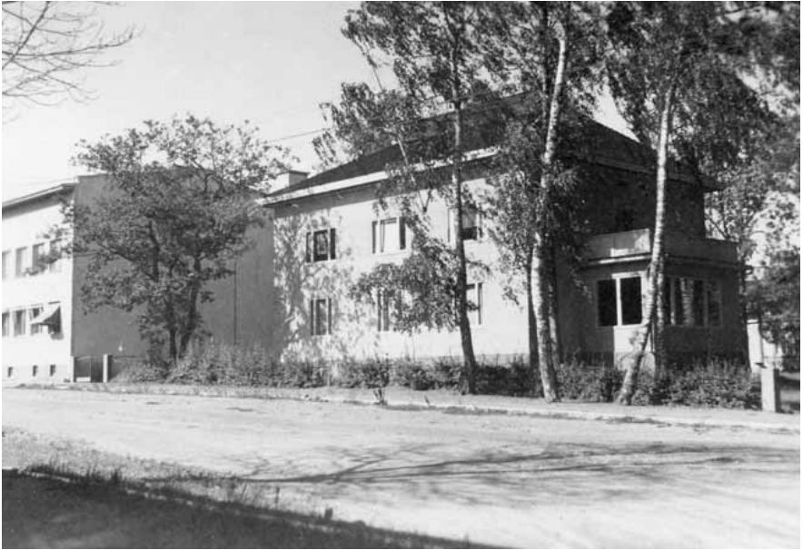
Konsulatets huvudbyggnad, den sk. Furstenborgska villan vid Nygatan i Mariehamn. Till vänster hörnet av Ålandsbanken.

skedde dels med båt, där man alltid åtföljdes av finländsk personal, dels med den egna bilen utan någon övervakning. Under resorna ägnades stort intresse åt fältbefästningarna, som i mer eller mindre gott skick fanns kvar längs kusten.