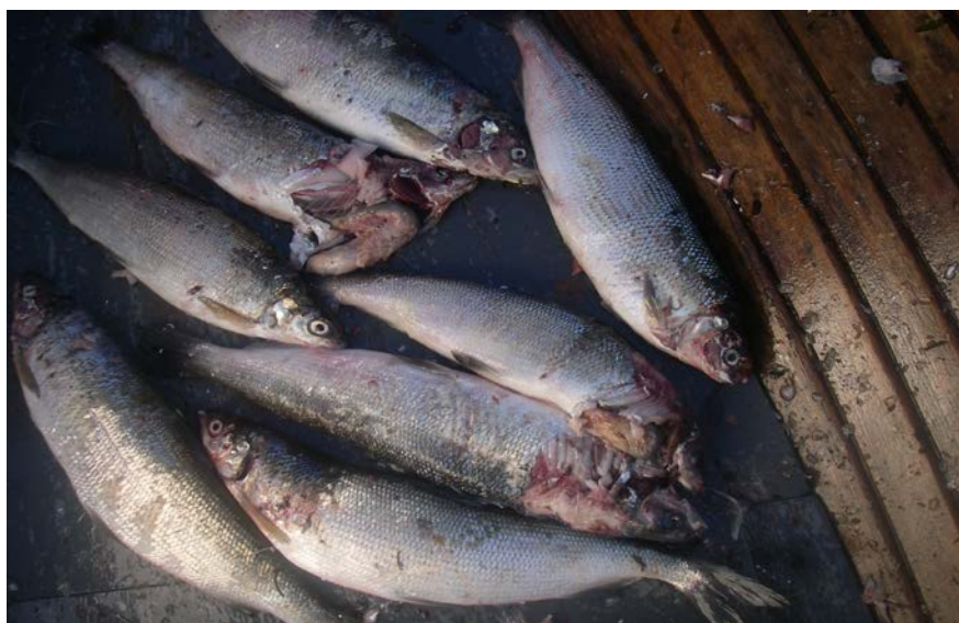
Bild av skarvättna sikar ( Coregonus lavaretus ), Åland september 2009.

Det åländska fisket bedrivs i huvudsak med bottengarn på relativt grunt vatten. Dessa nät är lätta för skarvarna att vittja, vilket medfört stora problem för yrkesfiskarna. Problemen är främst skador på fisk och redskap, uppäten fisk samt att fisken skräms från fiskeplatserna.