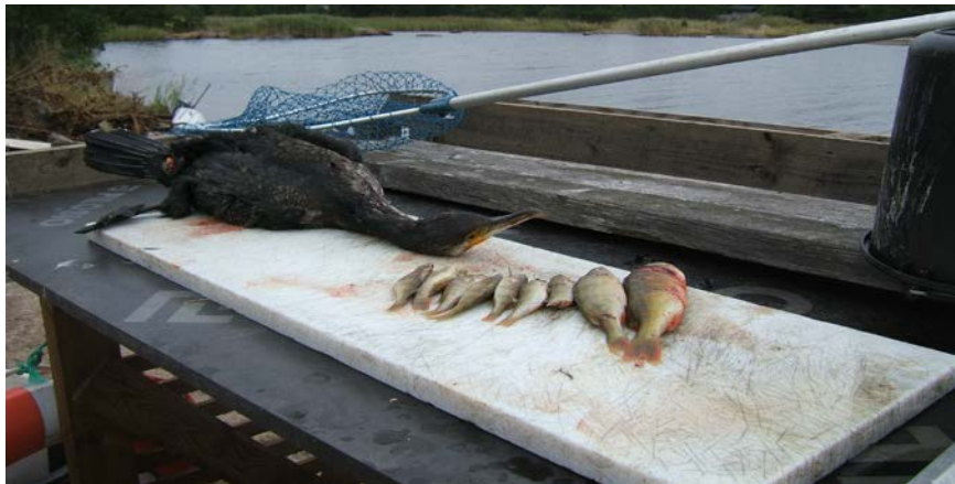
Maginnehåll från en skjuten skarv, 9 st. abborrar ( Perca fluviatilis ). Åland, oktober 2009.

att skarven hotar återväxten hos ekonomiskt viktiga fiskbestånd och att skadan är att betrakta som allvarlig.