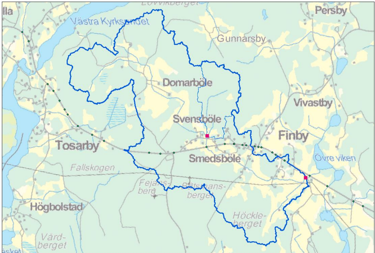
Avrinningsområden för provtagningsspunkt 1 & 2, med inbrända diken och trummor