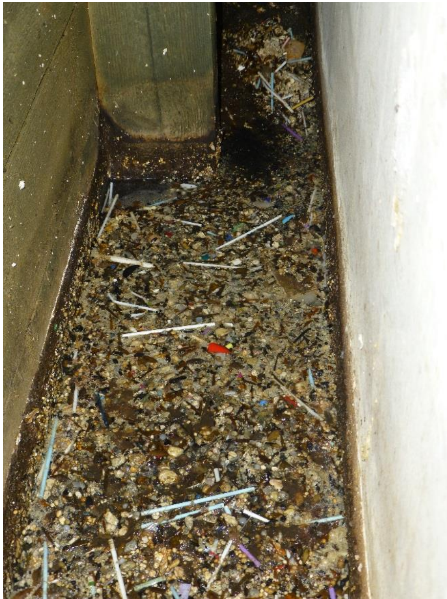
Bild från Lotsbroverket, Mariehamn. Tops och mindre plastskräp.

Enligt Mariehamns stad kommer årligen 30 ton sopor till reningsverket som inte hör hemma i avloppsvattnet. Tops är exempel på sådant skräp. Mariehamns stad har tagit fram information om vad som inte är lämpligt för avloppet och påminner om att toalettstolen inte är en soptunna 59 .