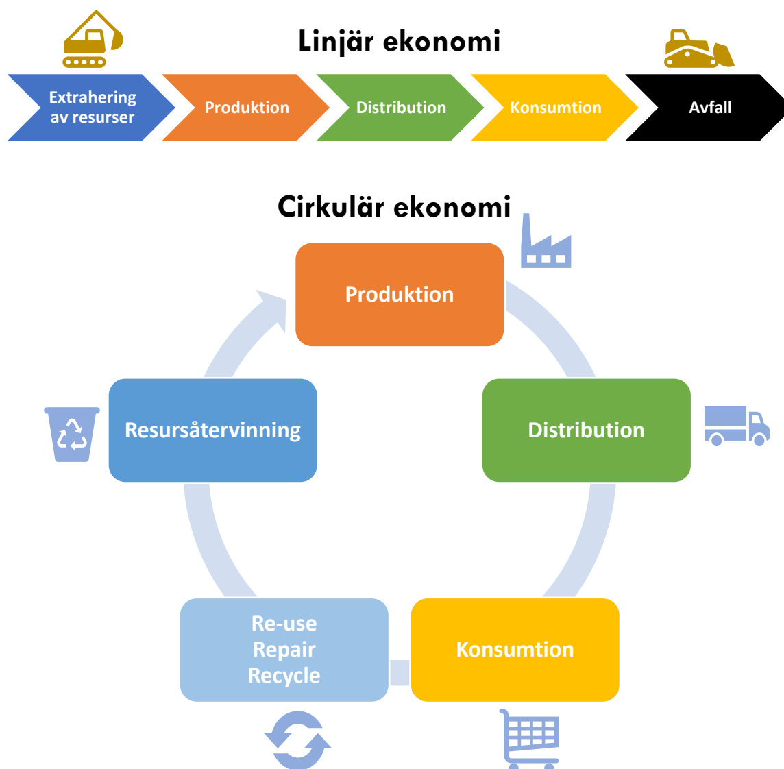
Figur 1. Ett samhälle baserat på linjär ekonomi urholkar över tiden oundvikligen dess bärkraft såväl ekonomiskt, socialt, miljö som kulturellt. Genom att frångå ett konsumtionssamhälle där linjärt ekonomiskt tänk i bl.a. resurshantering råder till cirkulär ekonomiskt. Således kan ett mer framtida hållbart samhälle växa fram. Detta säkerställer exempelvis en ansvarsfull och tryggad resurshantering av bl.a. plast.

MISE byter successivt ut kompostpåsar av majsstärkelse till påsar av papper för att undvika problem med att plastpåsar från dagligvaruhandeln hamnar i komposten. Byte av kompostpåsar påbörjas i flerbostadshus och i kommunernas verksamhet under januari 2019 och för egnahemshus med åttafacks-