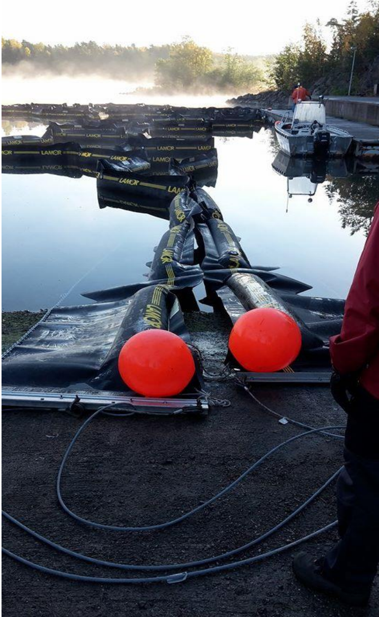
Bild 2. Planen. Båtarna bogserar längs en förbestämd rutt